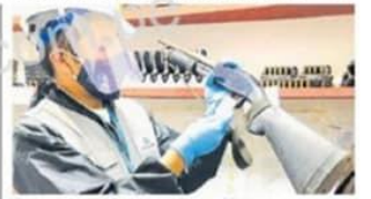
Empresa contaba con varios ambientes.