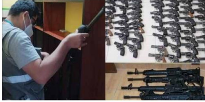
Armamento incautado en Ayacucho e Ica.

La Superintendencia Nacional de Control de Servicios de Seguridad, Armas, Municiones y Explosivos de Uso Civil (Sucamec) incautó, a través de la Jefatura Zonal de Ica, 120 armas de fuego a tres empresas de seguridad privada que operaban en Ayacucho e Ica sin contar con los requisitos mínimos de seguridad para el almacenamiento de las mismas.