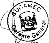
RUBEN ORLANDO RODRIGUEZ RABANAL Superintendente Nacional Superintendencia Nacional de Control de Servicios de Seguridad, Armas, Municiones y Explosivos de Uso Civil - SUCAMEC