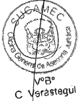
RUBEN ORLANDO RODRIGUEZ RABANAL Superintendente Nacional Superintendencia Nacional de Control de Servicios de Seguridad, Armas, Municiones y Explosivos de Uso Civil - SUCAMEC