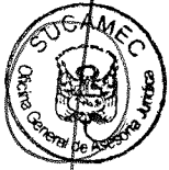
RUBEN ORLANDO RODRIGUEZ RABANAL Superintendente Nacional Superintendencia Nacional de Control de Servicios de Seguridad, Armas, Municiones y Explosivos de Uso Civil - SUCAMEC