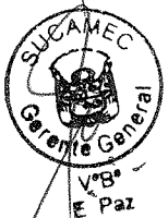
RUBEN ORLANDO RODRIGUEZ RABANAL Superintendente Nacional Superintendencia Nacional de Control de Servicios de Seguridad, Armas, Municiones y Explosivos de Uso Civil - SUCAMEC