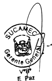
RUBÉN ORLANDO RODRIGUEZ RABANAL Superintendente Nacional Superintendencia Nacional de Control de Servicios de Seguridad, Armas, Municiones y Explosivos de Uso Civil - SUCAMEC