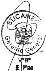
RUBÉN ORLANDO RODRIGUEZ RABANAL Superintendente Nacional Superintendencia Nacional de Control de Servicios de Seguridad Armas, Municiones y Explosivos de Uso Civil - SUCAMEC