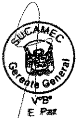
RUBÉN ORLANDO RODRIGUEZ RABANAL Superintendente Nacional Superintendencia Nacional de Control de Servicios de Seguridad, Armas, Municiones y Explosivos de Uso Civil - SUCAMEC