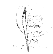
RUBÉN ORLANDO RODRIGUEZ RABANAL Superintendente Nacional Superintendencia Nacional de Control de Servicios de Seguridad, Armas, Municiones y Explosivos de Uso Civil - SUCAMEC