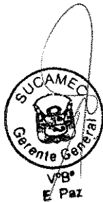
RUBÉN ORLANDO RODRÍGUEZ RABANAL Superintendente Nacional Superintendencia Nacional de Control de Servicios de Seguridad, Armas, Municiones y Explosivos de Uso Civil - SUCAMEC