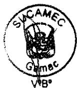
RUBEN ORLANDO RODRIGUEZ RABANAL Superintendente Nacional Superintendencia Nacional de Control de Servicios de Seguridad, Armas, Municiones y Explosivos de Uso Civil - SUCAMEC