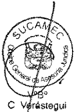
RUBEN ORLANDO RODRIGUEZ RABANAL Superintendente Nacional Superintendencia Nacional de Control de Servicios de Seguridad, Armas, Municiones y Explosivos de Uso Civil - SUCAMEC