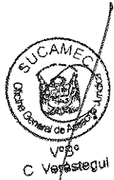
RUBEN ORLANDO RODRIGUEZ RABANAL Superintendente Nacional Superintendencia Nacional de Control de Servicios de Seguridad, Armas, Municiones y Explosivos de Uso Civil - SUCAMEC