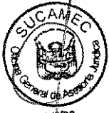
RUBEN ORLANDO RODRIGUEZ RABANAL Superintendente Nacional Superintendencia Nacional de Control de Servicios de Seguridad, Armas, Municiones y Explosivos de Uso Civil - SUCAMEC