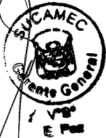
JUAN ALBERTO DULANTO ARIAS Superintendente Nacional Superintendencia Nacional de Control de Servicios de Seguridad, Armas, Municiones y Explosivos de Uso Civil - SUCAMEC