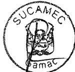
RUBÉN ORLANDO RODRIGUEZ RABANAL Superintendente Nacional Superintendencia Nacional de Control de Servicios de Seguridad, Armas, Municiones y Explosivos de Uso Civil - SUCAMEC