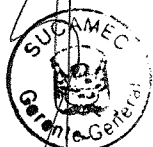
RUBÉN ORLANDO RODRIGUEZ RABANAL Superintendente Nacional Superintendencia Nacional de Control de Servicios de Seguridad, Armas, Municiones y Explosivos de Uso Civil - SUCAMEC