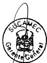
RUBEN ORLANDO RODRIGUEZ RABANAL Superintendente Nacional Superintendencia Nacional de Control de Servicios de Seguridad, Armas, Municiones y Explosivos de Uso Civil - SUCAMEC