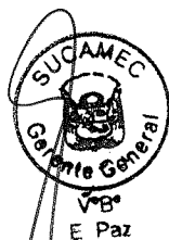
RUBÉN ORLANDO RODRÍGUEZ RABANAL Superintendente Nacional Superintendencia Nacional de Control de Servicios de Seguridad, Armas, Municiones y Explosivos de Uso Civil - SUCAMEC