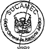
RUBÉN ORLANDO RODRIGUEZ RABANAL Superintendente Nacional Superintendencia Nacional de Control de Servicios de Seguridad, Armas, Municiones y Explosivos de Uso Civil - SUCAMEC