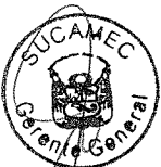
RUBEN ORLANDO RODRIGUEZ RABANAL Superintendente Nacional Superintendencia Nacional de Control de Servicios de Seguridad, Armas, Municiones y Explosivos de Uso Civil - SUCAMEC