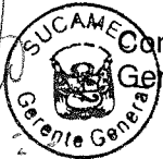
..... RUBÉN ORLANDO RODRIGUEZ RABANAL Superintendente Nacional Superintendencia Nacional de Control de Servicios de Seguridad, Armas, Municiones y Explosivos de Uso Civil - SUCAMEC