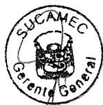
RUBÉN ORLANDO RODRIGUEZ RABANAL Superintendente Nacional Superintendencia Nacional de Control de Servicios de Seguridad, Armas, Municiones y Explosivos de Uso Civil - SUCAMEC