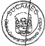
RUBEN ORLANDO RODRIGUEZ RABANAL Superintendente Nacional Superintendencia Nacional de Control de Servicios de Seguridad, Armas, Municiones y Explosivos de Uso Civil - SUCAMEC