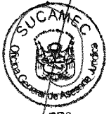
RUBEN ORLANDO RODRIGUEZ RABANAL Superintendente Nacional Superintendencia Nacional de Control de Servicios de Seguridad, Armas, Municiones y Explosivos de Uso Civil - SUCAMEC