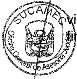
RUBEN ORLANDO RODRIGUEZ RABANAL Superintendente Nacional Superintendencia Nacional de Control de Servicios de Seguridad, Armas, Municiones y Explosivos de Uso Civil - SUCAMEC