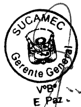
RUBÉN ORLANDO RODRIGUEZ RABANAL Superintendente Nacional Superintendencia Nacional de Control de Servicios de Seguridad, Armas, Municiones y Explosivos de Uso Civil - SUCAMEC