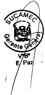
RUBÉN ORLANDO RODRIGUEZ RABANAL Superintendente Nacional Superintendencia Nacional de Control de Servicios de Seguridad, Armas, Municiones y Explosivos de Uso Civil - SUCAMEC