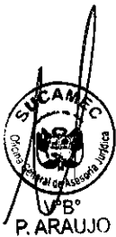
DERIK ROBERTO LATORRE BOZA Superintendente Nacional Superintendencia Nacional de Control de Servicios de Seguridad Armas, Municiones y Explosivos de Uso Civil - SUCAMEC