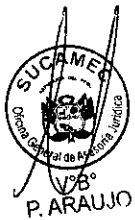
DERIK ROBERTO LATORRE BOZA Superintendente Nacional Superintendencia Nacional de Control de Servicios de Seguridad Armas, Municiones y Explosivos de Uso Civil - SUCAMEC