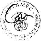
DERIK ROBERTO LATORRE BOZA Superintendente Nacional Superintendencia Nacional de Control de Servicios de Seguridad Armas, Municiones y Explosivos de Uso Civil - SUCAMEC