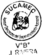
JUAN CARLOS MELÉNDEZ ZUMAETA Superintendente Nacional (e) Superintendencia Nacional de Control de Servicios de Seguridad, Armas, Municiones y Explosivos de Uso Civil - SUCAMEC