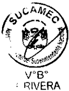
DERIK ROBERTO LATORRE BOZA Superintendente Nacional Superintendencia Nacional de Control de Servicios de Seguridad Armas, Municiones y Explosivos de Uso Civil - SUCAMEC