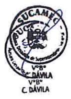
DERIK ROBERTO LATORRE BOZA Superintendente Nacional Superintendencia Nacional de Control de Servicios de Seguridad, Armas, Municiones y Explosivos de Uso Civil - SUCAMEC