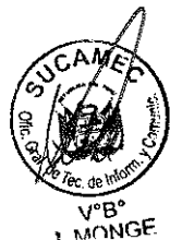
RUBEN ORLANDO RODRIGUEZ RABANAL Superintendente Nacional Superintendencia Nacional de Control de Servicios de Seguridad, Armas, Municiones y Explosivos de Uso Civil - SUCAMEC