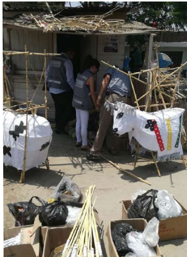
Chancay: el traslado e incineración del material contó con el monitoreo de agentes de la Unidad de Desactivación de Explosivos (UDEX) de la Policía Nacional del Perú y con el apoyo de personal especializado de la empresa Famesa S.A.

El 2016, la Sucamec, con el apoyo de la Unidad de Desactivación de Explosivos de la Policía Nacional del Perú (Udex) destruyó 59 toneladas de productos pirotécnicos a nivel nacional. Estos productos habían sido incautados en diversos operativos. La mayor destrucción se realizó el 24 de noviembre en Chancay (Lima), donde más de veinte toneladas de productos pirotécnicos fueron incinerados. Los materiales destruidos fueron decomisados por el Ministerio Público como resultado de una serie de intervenciones y permanecían almacenados desde el 2012. También se realizaron importantes destrucciones de pirotécnicos incautados en las instalaciones de la Dirección de Operaciones Especiales (Diroes) de la Policía Nacional del Perú.